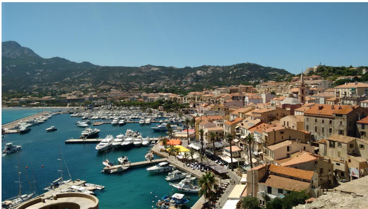
□ Calvi – Le port vu de la citadelle – 12/08/2018